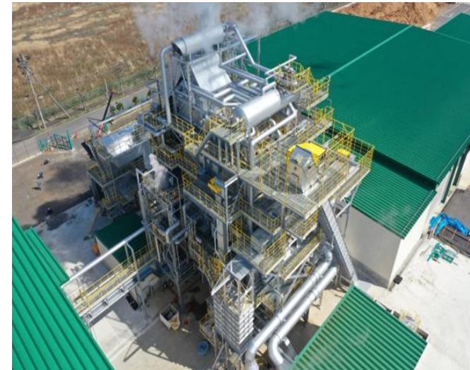
バイオマス発電所